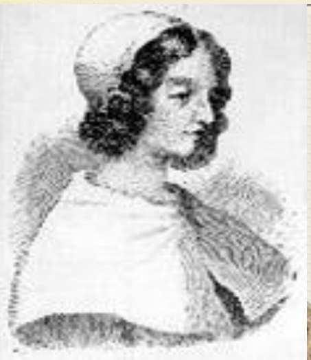
Jeanne Mance 1606-1673

Après la traversée de trois mois et une escale hivernale à Québec, elle arrive à Ville-Marie, le 17 mai 1642. Elle est accompagnée du gouverneur de la ville, Paul de Chomedey de Maisonneuve.