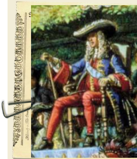
Louis-Hector de Callière 1648-1703

Le nom de cet homme français est Louis-Hector de Callière. Il invita plusieurs tribus amérindiennes à y participer, bien-sûr avec les Iroquois. Si le traité de paix n'avait pas existé, les Iroquois auraient pris Ville-Marie.