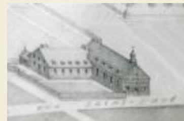
Section d'un dessin de l'Hôtel-Dieu, le montrant tel qu'il était en 1654.

Le premier hôpital s'appelle l'Hôtel-Dieu que Jeanne Mance a fondé à Ville-Marie en 1645 à l'extérieur du fort. Elle a construit cet hôpital parce qu'il y a eu beaucoup de blessés. Même Jeanne Mance s'est blessée en faisant une mauvaise chute sur la glace. Le bras droit de Jeanne Mance s'est cassé. Et, un miracle s'est produit à la chapelle du séminaire sur sa main droite. L'usage de sa main droite lui est revenu. Ce miracle fait sensation dans Paris. On voulait voir la «miraculée» qui était Jeanne Mance à Paris le 2 février 1659. Elle a vécu 67 ans et est morte le 18 juin 1673.